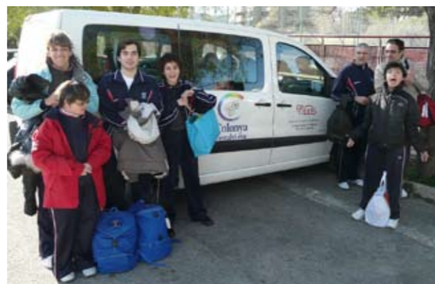
Els usuaris que participaren a l'esdeveniment.

SERVEI D'OCCI AUBORADA - COMPARTINT EL TEMPS LLIURE