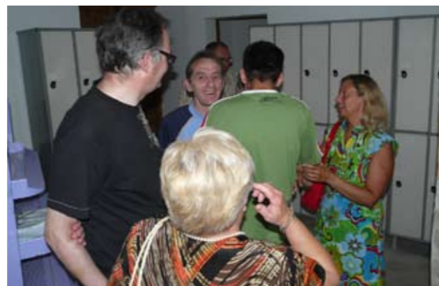
Alguns usuaris, famílies i gent vinculada a PRODIS

Un d'aquests tabús es el lligat a la sexualitat de les persones amb discapacitat, a qui es considera infantils i, per tant, desproveïdes de sexualitat. A la vegada, pareix que el sexe està reservat als cossos joves i perfectes que veiem als mitjans de comunicació, i que els altres que no som tan perfectes, la majoria, no tenim dret a gaudir-ne.