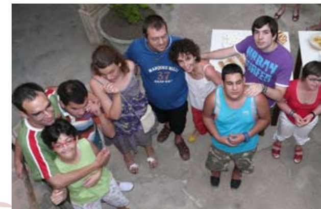
Alguns usuaris de PRODIS

Com s'ha dit, tenen uns impulsos sexuals, com tots els éssers humans, que no comprenen si nos els hi explicam. Saben que els agraden els petons i les carícies, com es natural, i és massa fàcil que algú es pugui aprofitar de la seva innocència i falta de informació. Aquest és el motiu principal pel qual una educació sexual es fa tan necessària. No es tracta d'estimular la sexualitat de ningú, sinó de ensenyar-los que el seu cos és seu i que ells són els que han de decidir qui els pot tocar i qui no i quines precaucions s'han de prendre, com una manera més de potenciar aquesta autonomia seva de la que tant parlem i que tant treballam. Part d'aquesta autonomia consisteix en donar-los la possibilitat de decidir sobre les possibilitats que tenen, si volen explorar-les o no i amb qui, ja que s'ha de recordar que la sexualitat està molt lligada a l'afectivitat, un pilar bàsic en la vida de tota persona.