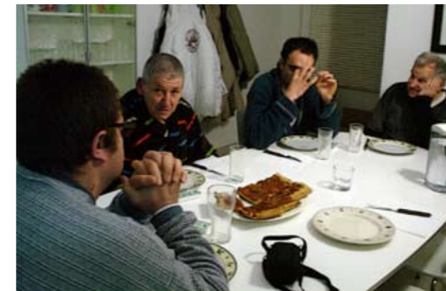
Els usuaris del pis tutelat compartint el sopar.

Ah!, no tots els dies són iguals, els caps de setmana tenim més temps per fer més coses i fer coses més diferents, ja que no anam a treballar al centre a Prodis, també anam a casa de les nostres famílies a passar temps amb ells, sortim a fer un cafetó, qualche dia a sopar, ... sempre i quan el pressupost ens ho permet.